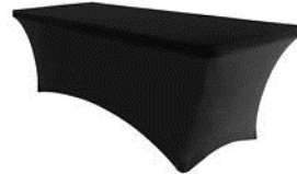
6 - 22 & 29 - 35 Wooden Tables (200x120) - Euro 150 + VAT